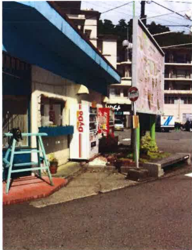
A石川県小松市栗津町ハ 72-1