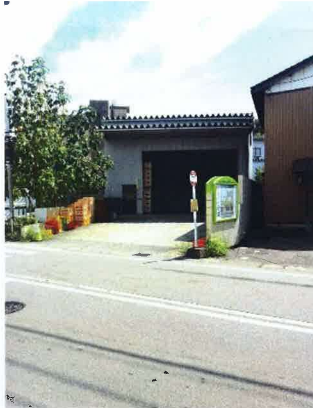
B石川県小松市栗津町ニ 61-1