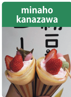
米粉豆乳クレープ