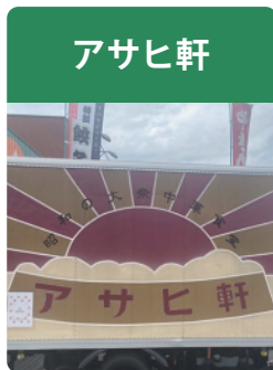
焼きめし・オムライス・餃子