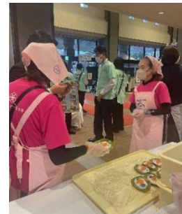
▲柿の葉寿司のふるまい（食生活改善推進協議会）