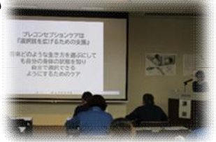
▲若者向けライフデザインセミナー

【概要】 若年世代が将来のライフデザイン（人生設計）に資する視点を持ち、男女を問わず自分の身体に関心を持ち、将来、希望する方が、安心安全で健やかな妊娠出産に備えた健康管理に取り組むプレコンセプションケアを普及啓発する。