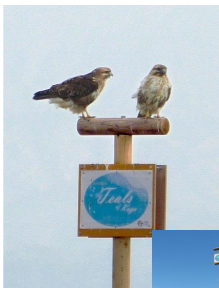
●猛禽ポストの設置事例（加賀市柴山潟）

かつて水田周辺には天日干しに用いる「はさ掛け」用のやぐら木材や立木が必ずあり、これが猛禽類にとって重要な止まり木になっていましたが、機械乾燥が中心となった現在は同様の機能が失われています。とくに、広大な干拓農地では止まり木が全くないため、ポストを設置することで多種多様な鳥類が利用することが考えられます。またブランド米の生産圃場の場合、ブランド米のラベル等の看板等を設置することで効果的な普及啓発ツールにもなります。