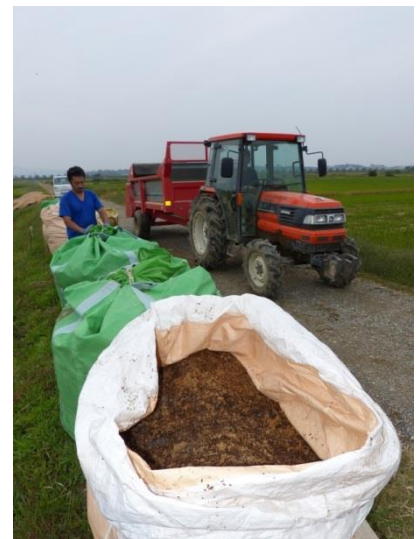
●循環型発酵堆肥の施用 （加賀市柴山潟）

環境省がCBD-COP10（生物多様性条約締約国名古屋会議）で世界に向けて発信した SATOYANA イニシアティブ の中で重視しているのが「 自然資源の循環利用 」です。再生可能な資源・エネルギーであるバイオマスの利活用は低炭素型循環社会の形成に有効であると共に、その利活用のある二次的自然（農地や里山）は多様な生物の生息・生育の場及び様々な生態系サービスの源泉となっています。このため、バイオマスの利活用を促進することは、生物多様性及び生態系サービスの保全の観点からも非常に有効であるとされています。