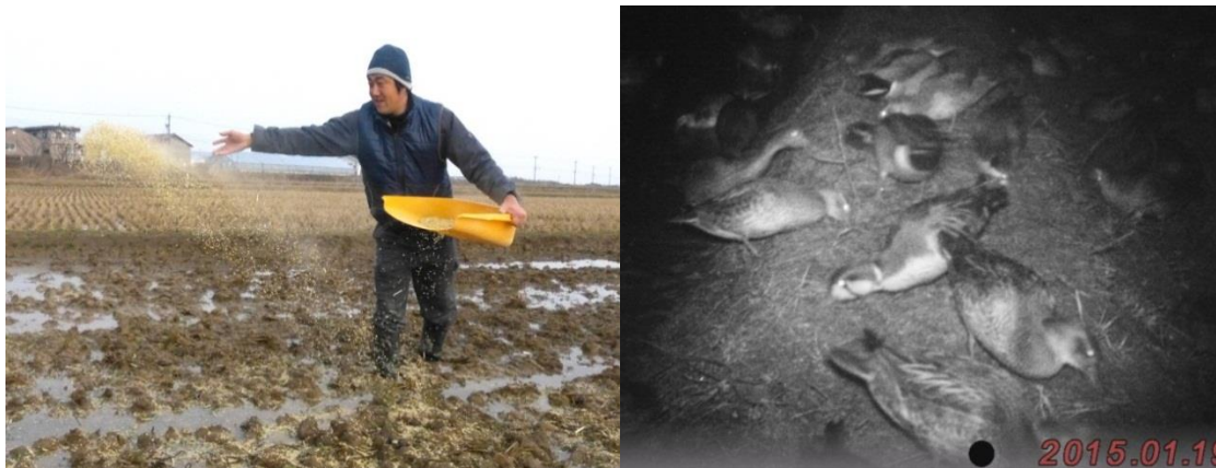
●屑米の散布作業（左）と撒かれた屑米を採食するトモエガモ等（右）。