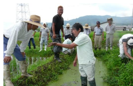
●水田ビオトープの事例（滋賀県高島市）

保全目的は承水路と同じですが、大がかりなものである必要ありません。畳一枚分程度の小規模なビオトープを数多く連続的に作る方ことで水生昆虫等の生態的回廊（コリドー）を創出することが可能になります。