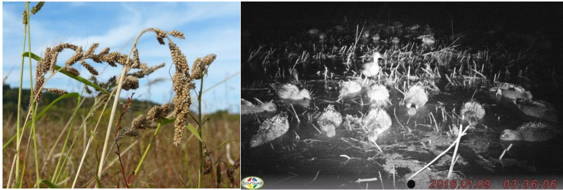
●試験圃場で栽培されたヒエ（左）と刈り倒し後のヒエ圃場で採食するカモ類（右）