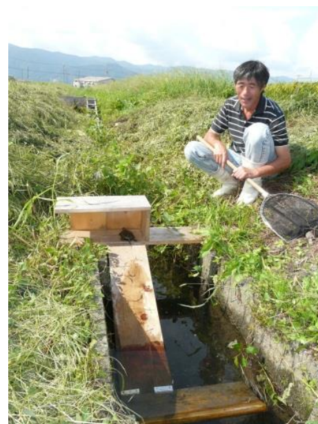
●亀かえるスロープの事例（滋賀県高島市）

排水路に落ちたカメやカエル、水鳥のヒナなどが脱出するための可動式スロープ。水田魚道にくらべ制作や設置が用意であるため取り組みやすい利点がある。ザリガニの穴による畦の漏水被害が多い圃場では、ザリガニを餌とするカメ類を保全することで営農上の効果も期待できます。