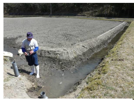
●水田承水路の事例（愛知県豊田市）

圃場内に畦等を設け、やや深堀した水路を設けることで、中干し期間中でも水生生物が生存できる環境を確保するもの。水口から圃場に入る用水が冷たい場合、水温をあげてから圃場内に入れて冷温障害を回避する営農上のメリットも得られます。