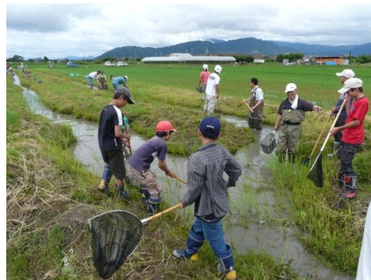
●休耕田ビオトープの事例（滋賀県高島市）

休耕田を利用した比較的大がかりなビオトープの造成。かつては「調整水田」として転作補償交付金制度の対象でしたが、現在は転作補償の対象にはなりません。ただし、周辺地域の学校児童の環境教育の舞台として活用できたり、通年型のビオトープとして水生昆虫や両生類、メダカ等の越冬環境としての湿地的役割をもつなど保全効果が高いため、農地としての利用が見込まれない場所などがある場合は設置を検討することが望ましいと考えられます。