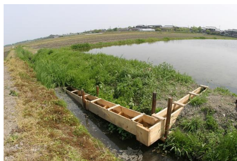
●水田魚道の事例（滋賀県高島市）

圃場整備等によって水田と排水路の落差が大きくなり、水田で産卵する魚類が圃場内に遡上できなくなっている状態を解消するもの。ただし圃場直下の排水路に水田繁殖性の魚類（フナ、ナマズ、メダカ等）が生息していることなどの設置条件があるので、設置に際しては周辺環境の生物相を把握してから設置を検討することが求められます。