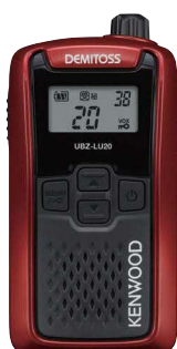
レッド RD JANコード: 4975514066254