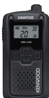
ブラック B JANコード: 4975514066247