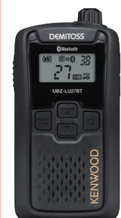
UBZ-LU27BT ブラック B JANコード: 4975514066292