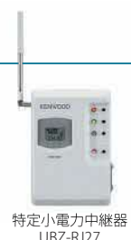
特定小電力中継器 UBZ-RJ27

20チャンネルの交互通話モード(シンプレックス)に加え、27チャンネルの中継器アクセスモード(セミデュプレックス)の使用を可能とし、全47チャンネルに対応します。 *中継器UBZ-RJ27(別売)が必要です。