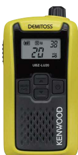
イエロー Y JANコード: 4975514066278