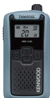
ブルーグレー H JANコード: 4975514066261