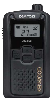
UBZ-LU27 ブラック B JANコード: 4975514066285