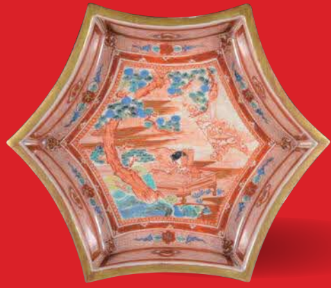
南柯之夢図六边形鉢 宮本屋窯 個人蔵