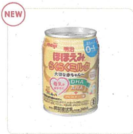
> 明治ほほえみらくらくミルク 240ml