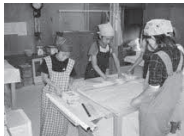
自分で打ったそばの味は格別▲

開館 …… 9時～17時 休館日 …… 水曜日(今月は3、10、17、24日) 入館料 …… 無料