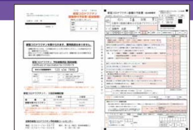
接種券付予診票見本