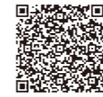
厚生労働省ホームページ