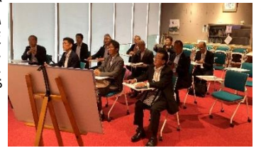
▶福島ロボットテストフィールド

また、研究者向け研究室の貸出しや性能評価設備、加工・分析設備などが整備され、研究開発に適した環境が提供されています。さらに、小・中学生向けのプログラムミング教室や出前講座など、人材育成にも積極的に取り組んでいます。