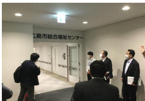
▲広島市総合福祉センター