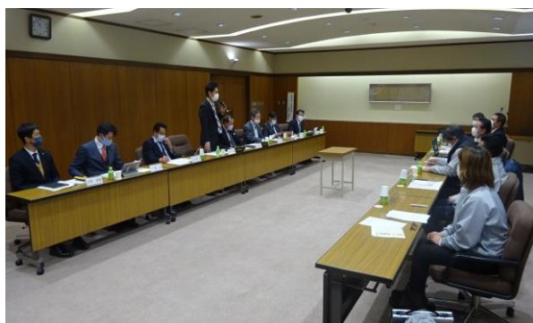
▲意見交換会（令和4年1月14日）

今後、この条例を実効性のあるものとするため、市当局がどのような取組を行っていくのか注視するとともに必要な助言や提言を行っていかなければならない。