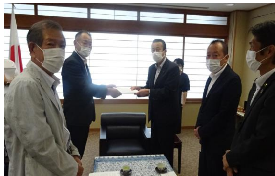
▲市長への提言申し入れ(令和4年8月2日)