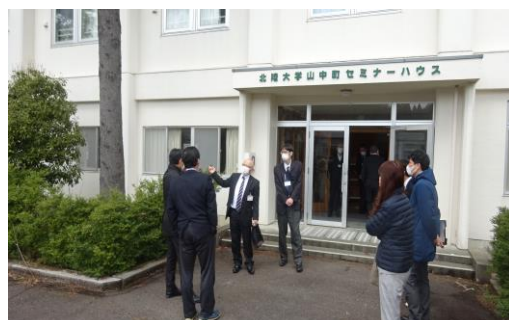
▲旧看護学校生徒宿舎