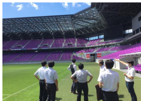
▲サンガスタジアム(京都府亀岡市)