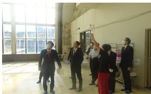
▲加賀市水泳プール