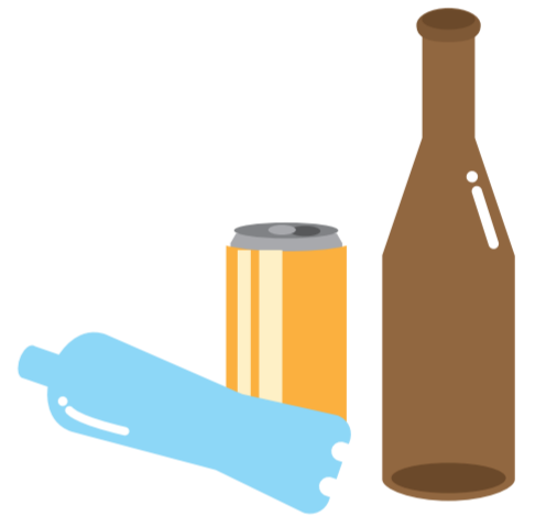
屋外に放置された空きビン・缶・ペットボトル