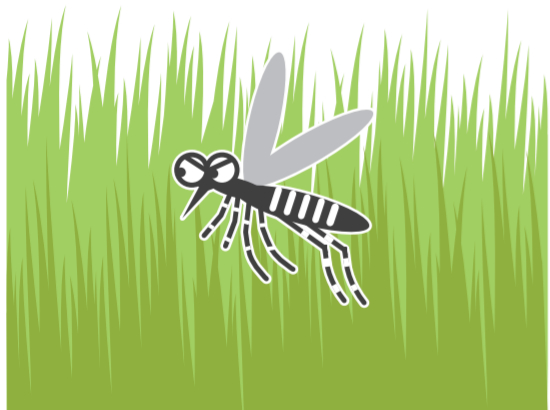
風通しの悪いやぶ・草むら

公園、学校、寺社、空海港、駅などの施設を管理されている方もご協力をお願いします!