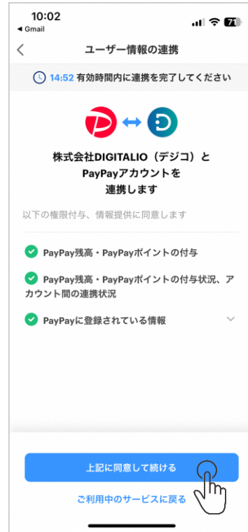
③上記に同意して続けるをタップ