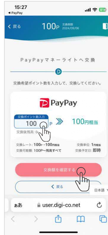
④ポイント数を決めて交換額を確認するをタップ