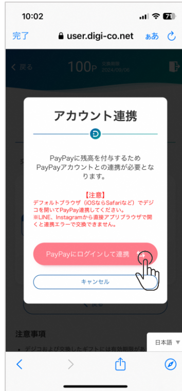
②PayPayにログインして連携をタップ