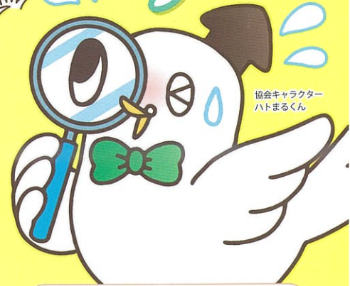
協会キャラクター ハトまるくん