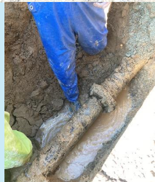
湖城町2丁目 漏水状況