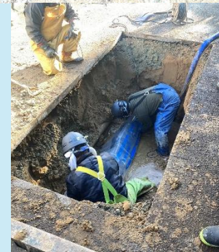
湖城町2丁目 修繕状況