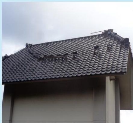
▲山中中学校屋根瓦落下