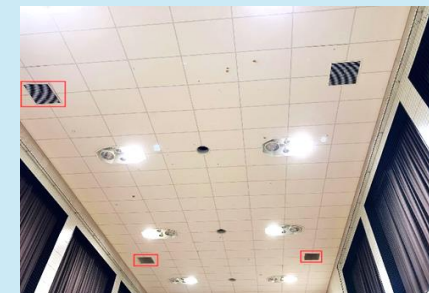
▲スポーツセンターサブアリーナ天井落下