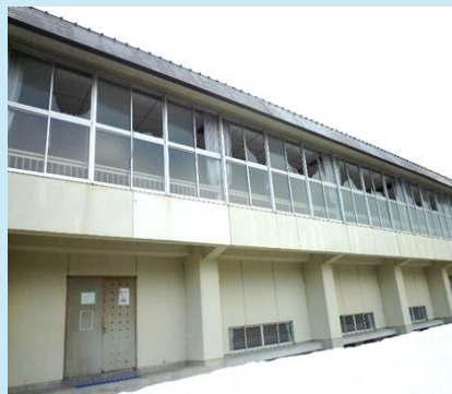
▲山中健民体育館ガラス窓破損