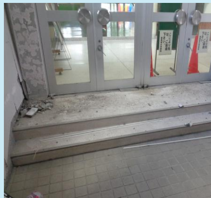
▲錦城東小学校渡り廊下 壁、床及び扉破損