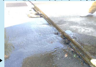
スポーツセンター水道管破損▶