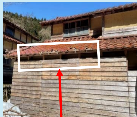
瓦（南・東棟瓦）破損・軒瓦が落ちている