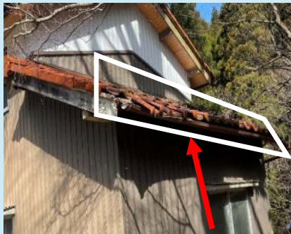
軒先の垂下・瓦の破損・瓦の下地腐食