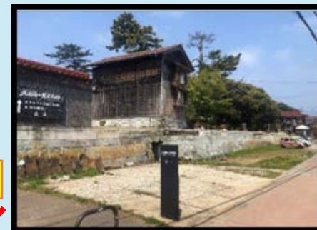
東堀 ※板堀開口部復旧