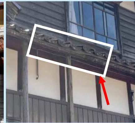
軒先の垂下・瓦の破損・瓦の下地腐食