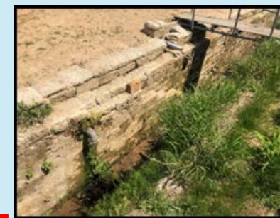
水路護岸 ※深田石積み直し 板石張り直し