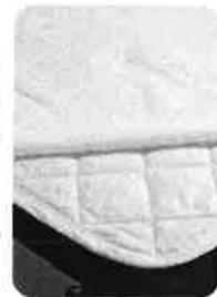
ダニサルベドパッドを使用した際の防ダニ効果について