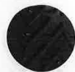
滑りにくさを追求した特殊デザインの靴底