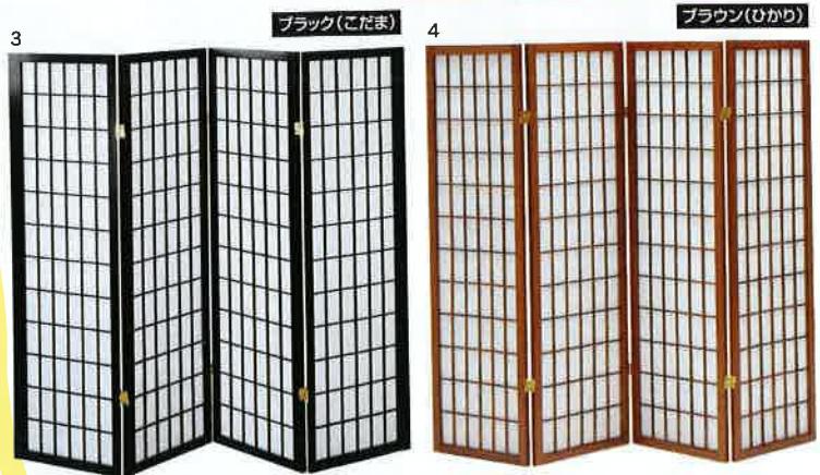
3-4 1800和風衝立4連 W1800×D20×H1500