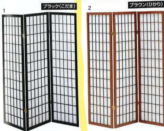
1-2 1350和風衝立3連 W1350×D20×H1500