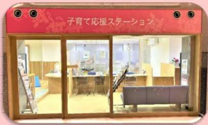
子育て応援ステーション 詳しくはこちら ↓