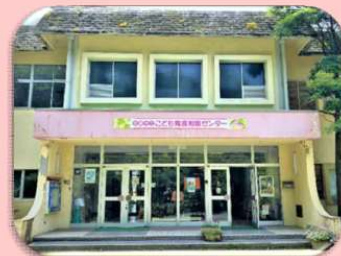
子ども育成相談センター 詳しくはこちら ↓