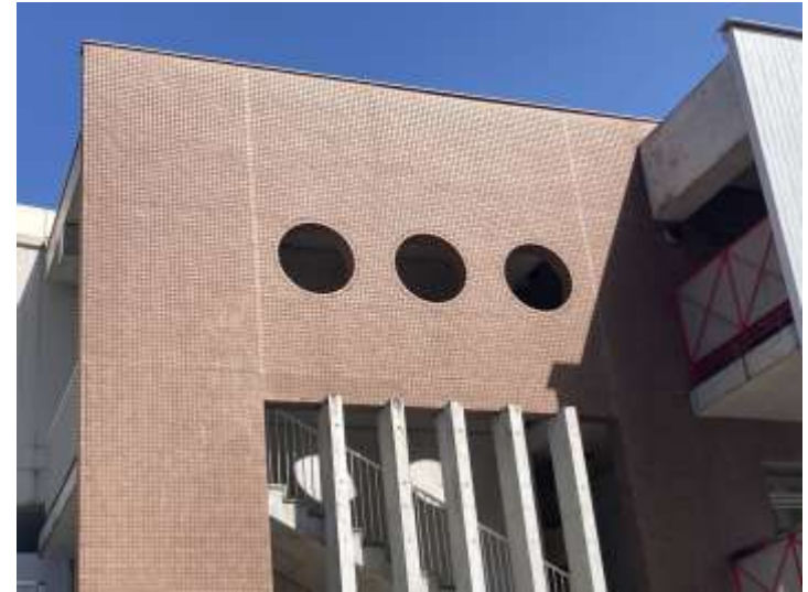
【 西側階段室側 近景 】

法人名：社会福祉法人 伊奈美園（いなみえん） 施設名：幼保連携型認定こども園 キッズランドいなみえん 所在地：石川県加賀市片山津温泉井6番地 施設概要：鉄筋コンクリート造 3階建（平成11年10月築） 建築面積：807.16㎡ / 延べ面積：2018.86㎡