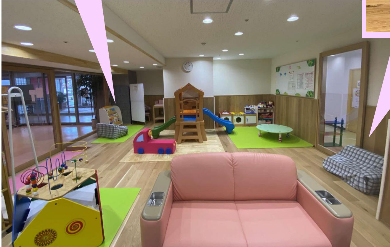
ソファの設置と チラシ等啓発コーナー