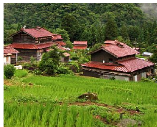
東谷地区景観整備