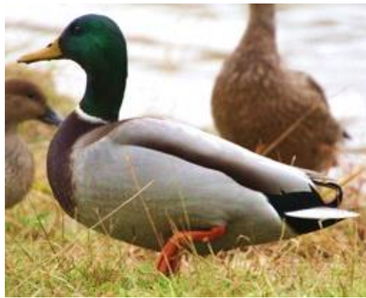
片野鴨池保全活動