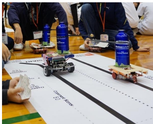
ロボレーブ国際大会の開催

ご寄附いただいた金額から返礼品費用を除いた額を各事業に活用させていただきました。