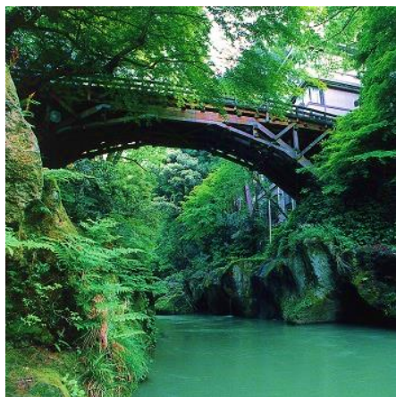
山中温泉こおろぎ橋

今後も皆さまから寄せられた想いを大切にまちづくりに活かしてまいりますので、引き続きご協力いただけますよう、よろしく願いいたします。