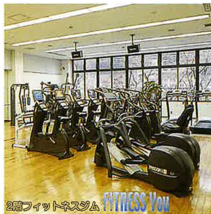
2階フィットネスジム FITNESS You

最新式のフィットネスマシンと、専属のインストラ クターによる指導で、運動不足の解消、ダイエット、 さらには腰痛や肩こり、関節の痛みの緩和など目的 に合わせたプログラムで安心して運動出来ます。