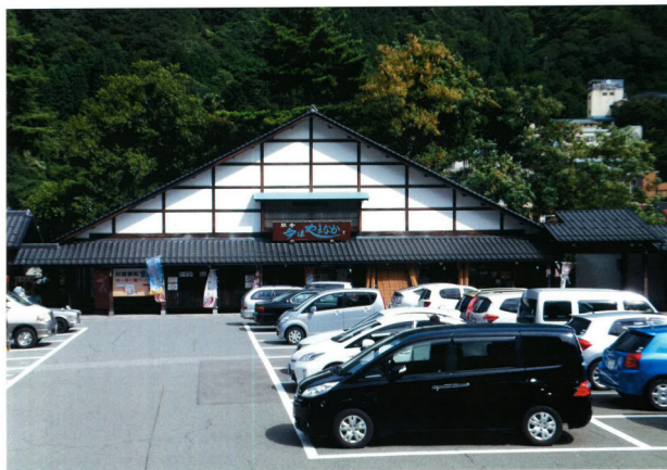
道の駅 駅舎 今はやまなか