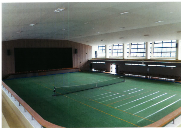
すこやかホール 内部