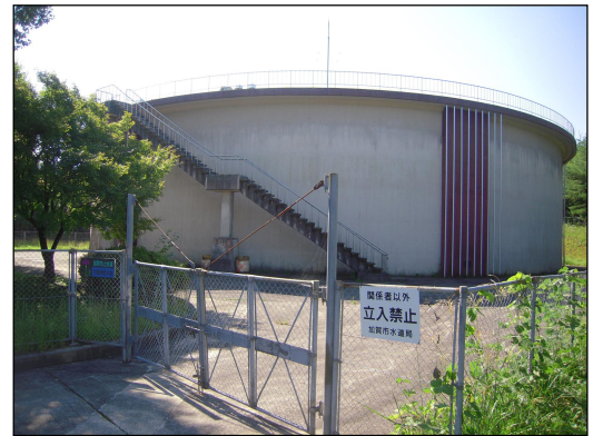
【大聖寺配水池（貯水量 7,000 m 3 ）】