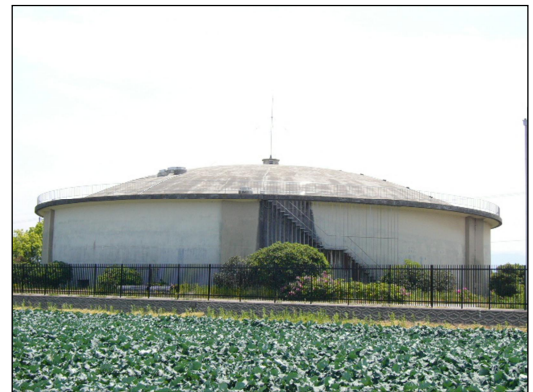
【七日市受水池（貯水量 5,700 m 3 ）】