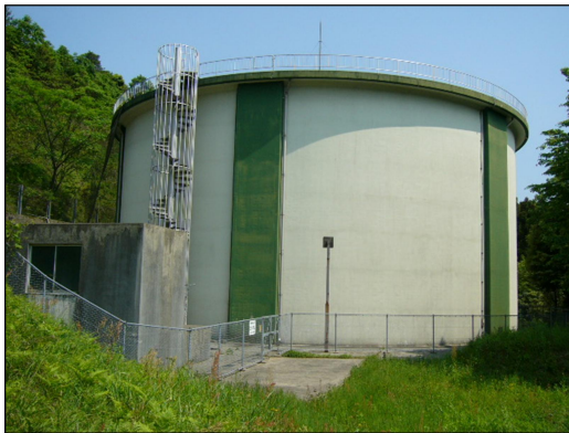
【山代配水池（貯水量 6,300 m 3 ）】

適切な浄水処理により、水道水質基準を十分に満たしています。配水における残留塩素については、配水距離、滞留時間の長短及び配管の材質によってその値に差異が生じています。消毒剤、凝集剤の管理を徹底し、クリプトスポリジウムの汚染対策として、ろ過後の濁度の管理も徹底しています。