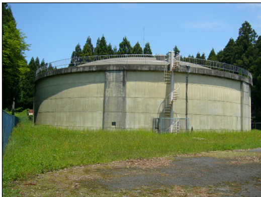
【片山津配水池（貯水量 5,000 m 3 ）】