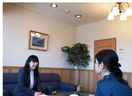
ぬくもりのある素敵な応接室

—住宅のリフォームだと、効率的な家事動線を確認したり、水回りの使いやすさを考えたりするのに女性の方が得意とする部分が多いかもしれませんね。