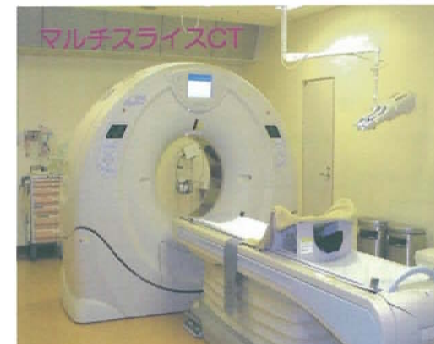
※救急関連高度医療機器整備（平成23年度）