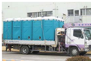
仮設トイレ等の物資を搬送