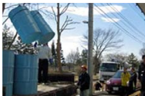
全国から集めた燃料を搬送

災害発生時に統合新病院、周辺地域の復旧工事のために必要な工事用資機材の調達、協力会社への協力要請、現地における業務用の自転車、オートバイ、自動車を確認します。また、食糧、飲料水、日用雑貨等の生活物資、燃料、仮設トイレ等の必要物資を全国から集め、船・ヘリコプター、運搬車両、運搬要員を確保し、日夜被災地へ搬送します。