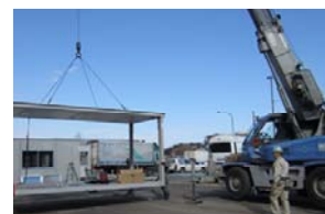
プレハブ小屋を設置