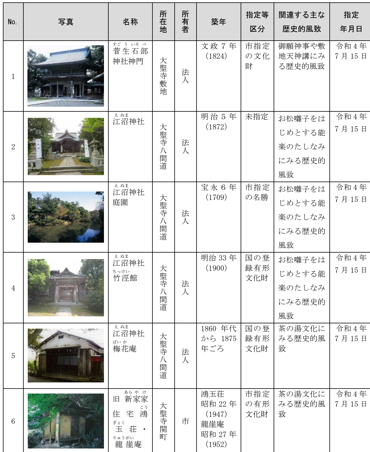
歴史的風致形成建造物に指定された建造物及び指定候補一覧

当該重点区域において、指定した歴史的風致形成建造物及び指定候補は、以下のとおりである。