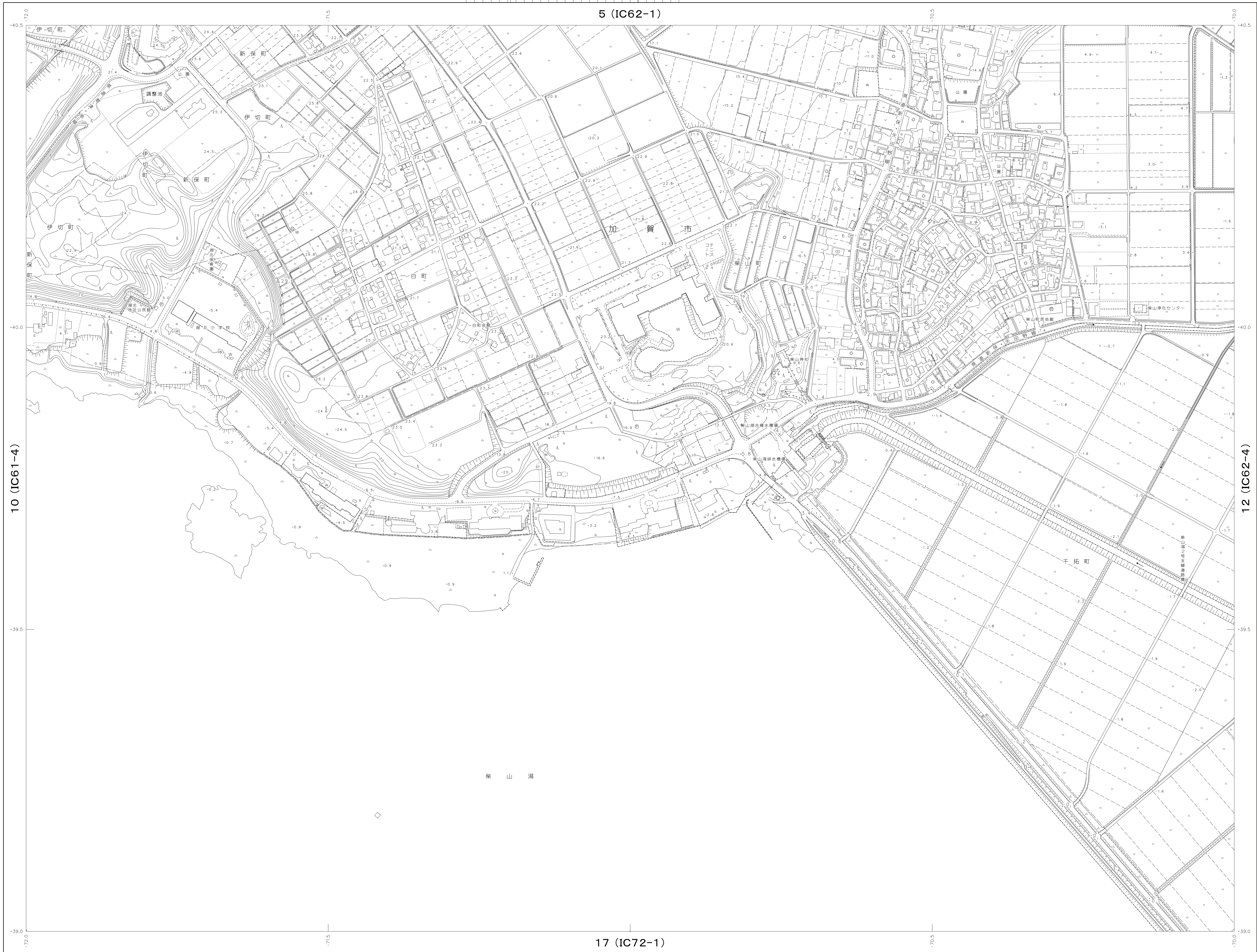
11 (VII-IC 62-3)