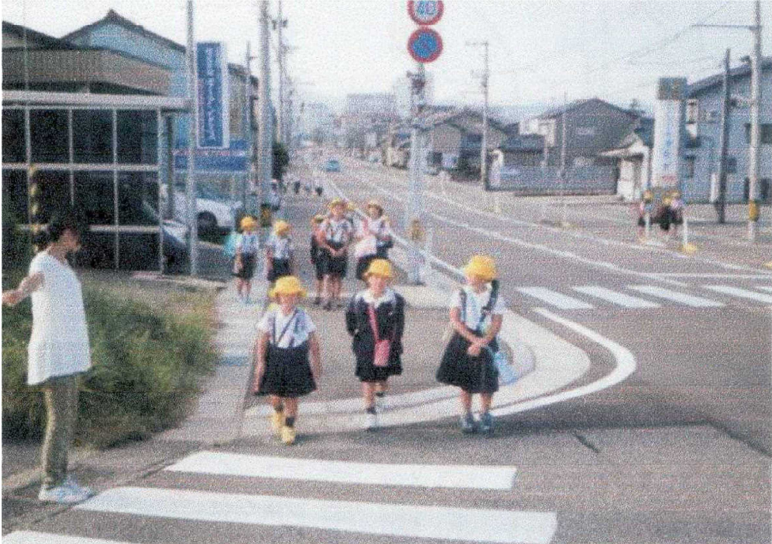
〔県道串加賀線 歩道整備（バリアフリー化）〕