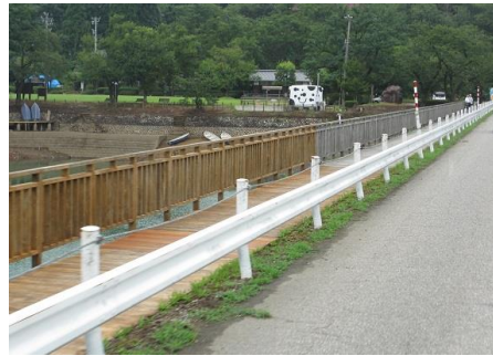
堤体に面した木製の歩道

ルの堤体に面した木製の歩道があり、桜ヶ池の眺めを楽しみながら散策できます。木製の歩道は、築十数年が経過し、老朽化したことにより修繕を要し、市が委託するシルバー人材センターの職員が、100メートル単位で修繕をし、整備を進めているとのことでありました。