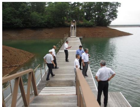
農林事業で整備した浮き橋

の公園管理に対しての課題等を伺うことができました。当委員会でも、今回の視察で学んだことを踏まえ、柴山瀉遊歩道の延伸及び魅力向上に役立てたいと思います。